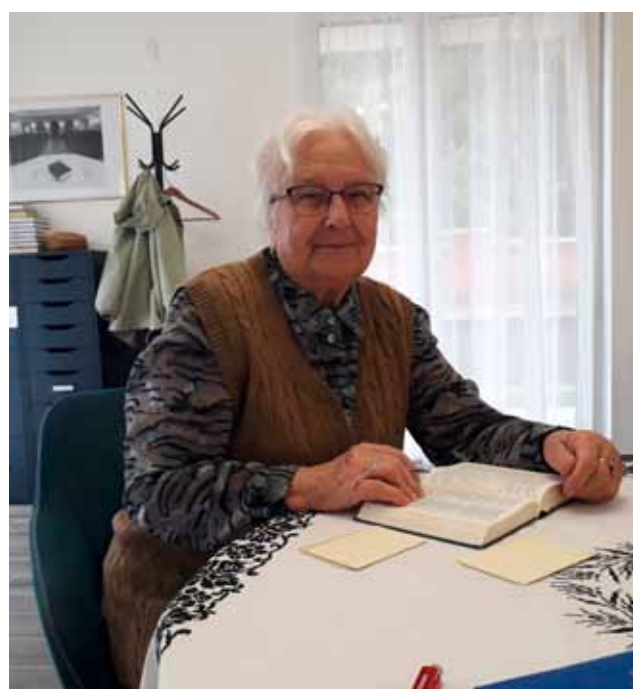
Ebben az évben kézzel készített Igés kártyákkal is készültünk a Ráday napokra