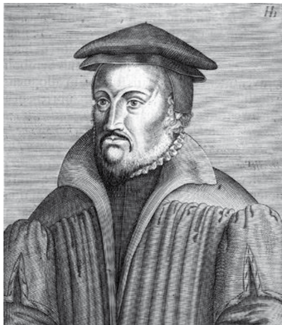
Casparus Olevianus 1536-1587

Prédikátor, a hittudományok doktora, teológiai tanár.