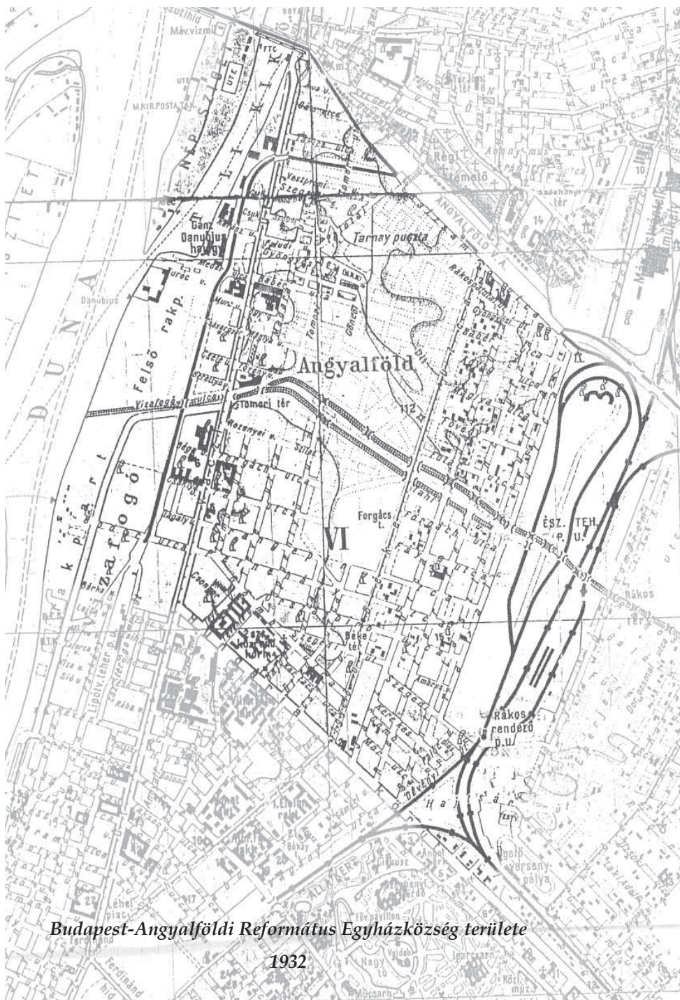
Budapest-Angyalföldi Református Egyházközség területe