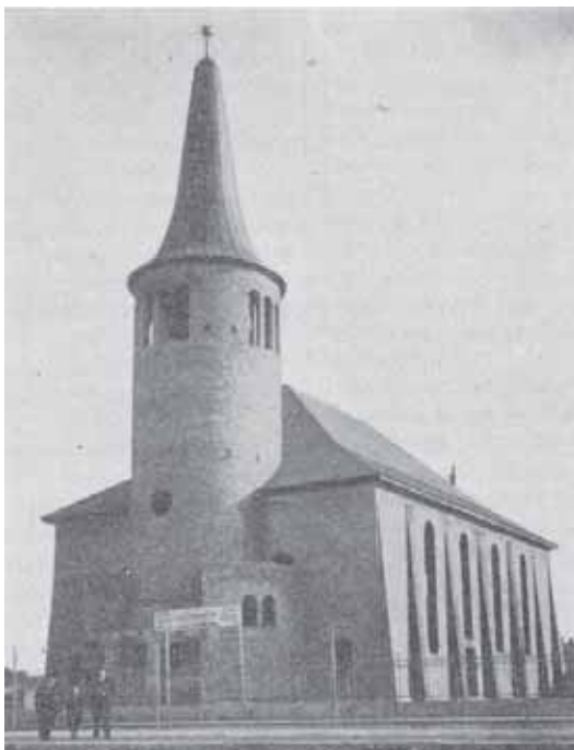
A budapest-angyalföldi ref. gyülekezet épülő temploma

A gyülekezet 1931 őszen megválasztotta első parókus lelkipásztorát, aki- „egyhangú meghívás útján” - viselve a templom építésének befejezését, a nehéz időszakokban is fáradhatatlanságot mutatva munkálkodott a cél érdekében.