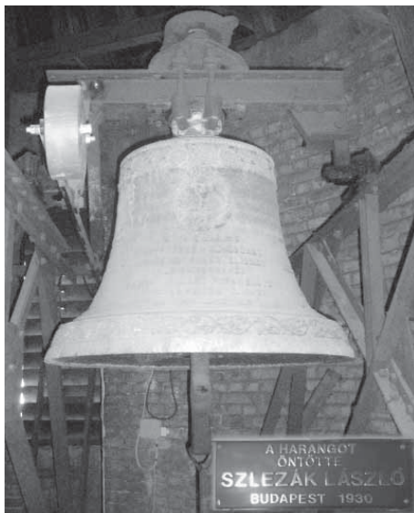
A toronyban „lakó” harang, és a 2008-ban felavatott emléktábla