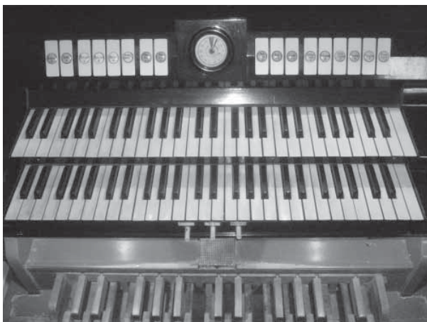
A megvalósult Rieger orgona játszóasztala

Ezt a jelenleg is meglévő orgonát a bejárattal szemben lévő karzaton helyezték el.