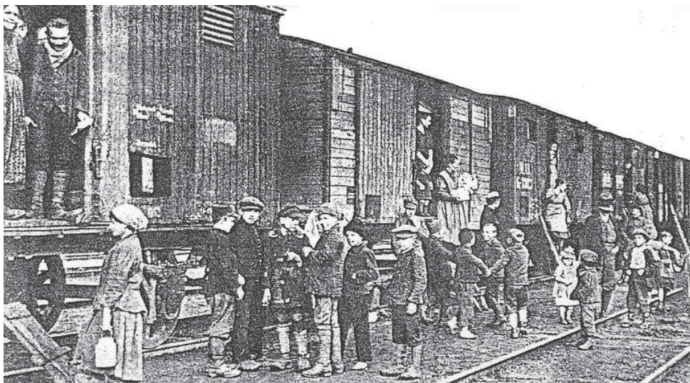
A "Rákosrendezői Vagonváros" 1932.

Angyalföld a 20. század elejére Budapest egyik legjelentősebb ipari körzetévé vált 2 , nagy létszámú munkás lakó- nyomornegyedeket is magába foglalva.