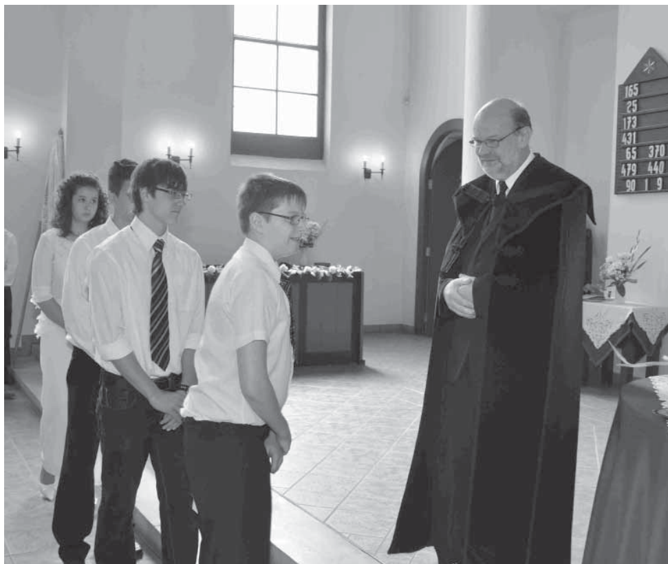
Konfirmációs kép - 2011

2006. óta az interneten is megtalálhatók vagyunk a www.frangepan.hu címen.